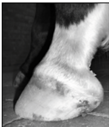
Huf mit korrekter Huf - Fessel - Achse.

Ein Pferd mit regelmäßig gestellten Gliedmaßen, belastet die Zehengelenke gleichmäßig und es verteilt die Körperlast auf alle Hufabschnitte. Sind die Gliedmaßenstellung oder der Verlauf der Zehenachse langfristig verändert, so stellt sich der Huf auf die veränderten Begebenheiten ein und ändert seine Form nachhaltig.